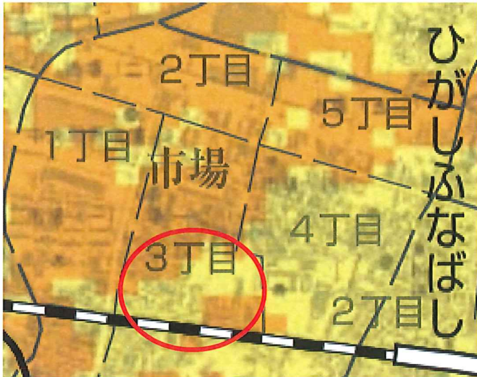
地震 千葉県北西部直下型地震 震度6強