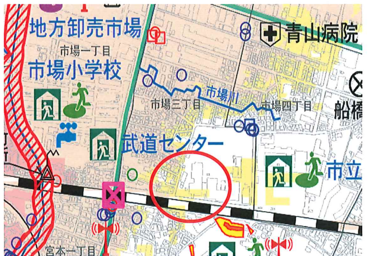
洪水・土砂崩れ 施設までの道路が土砂災害のリスク 小